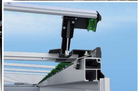
Portalbalken entriegeln und Verdeck ziehen Unlock portal beams and pull roof