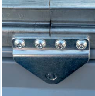
Schienenteilung Rail division